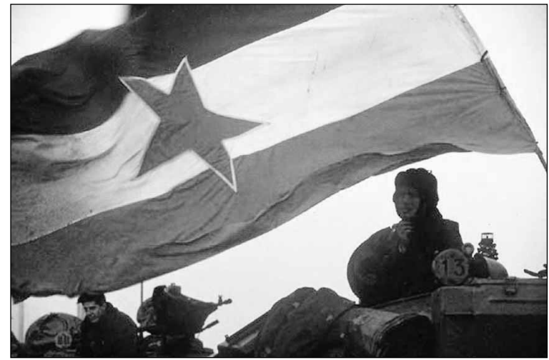
Ushtarë të Armatës Popullore të Jugosllavisë pas një beteje në terren. Autostrada e Beogradit 1991

Zv.ministri i Jashtëm sovjetik atëbotë, Julij Mikhaïlovich Kwizinskiy, bile kishte thënë se për shkak të problemeve të brend-